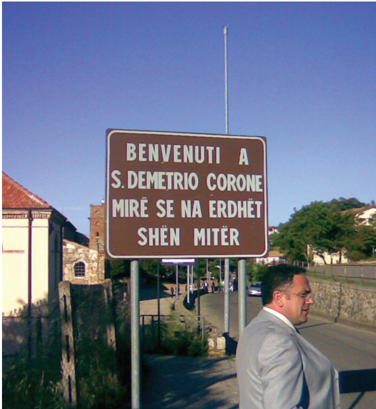
Hyrja në Shën Mitër