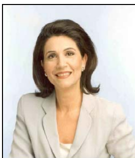
Rodi Kratsa Tsagaropoulou Primo Vice Presidente del Parlamento Europeo

Quest'anno il premio è stato dedicato al tema "Donne e uomini mano nella mano per l'uguaglianza tra i generi". I vincitori ex aequo di questa edizione, Rodi Kratsa Tsagaropoulou e Jan Willems, promuovono, seppur a livelli differenti, il ruolo della donna nella società. Jan Willems tramite le sue attività artistiche e Rodi Kratsa a livello istituzionale, incoraggiando l'adozione di politiche che rispettino l'uguaglianza dei generi all'interno del Parlamento Europeo e dell'Assemblea Parlamentare Euromediterranea.